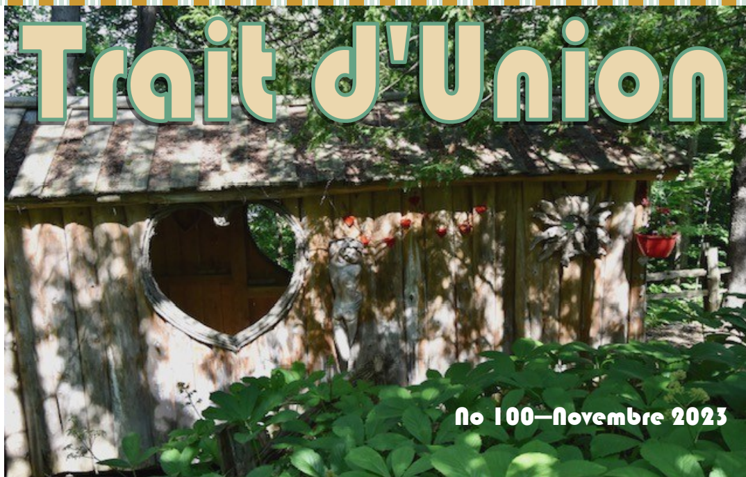
Photo prise dans le cadre de l'activité du 21 juin dernier.